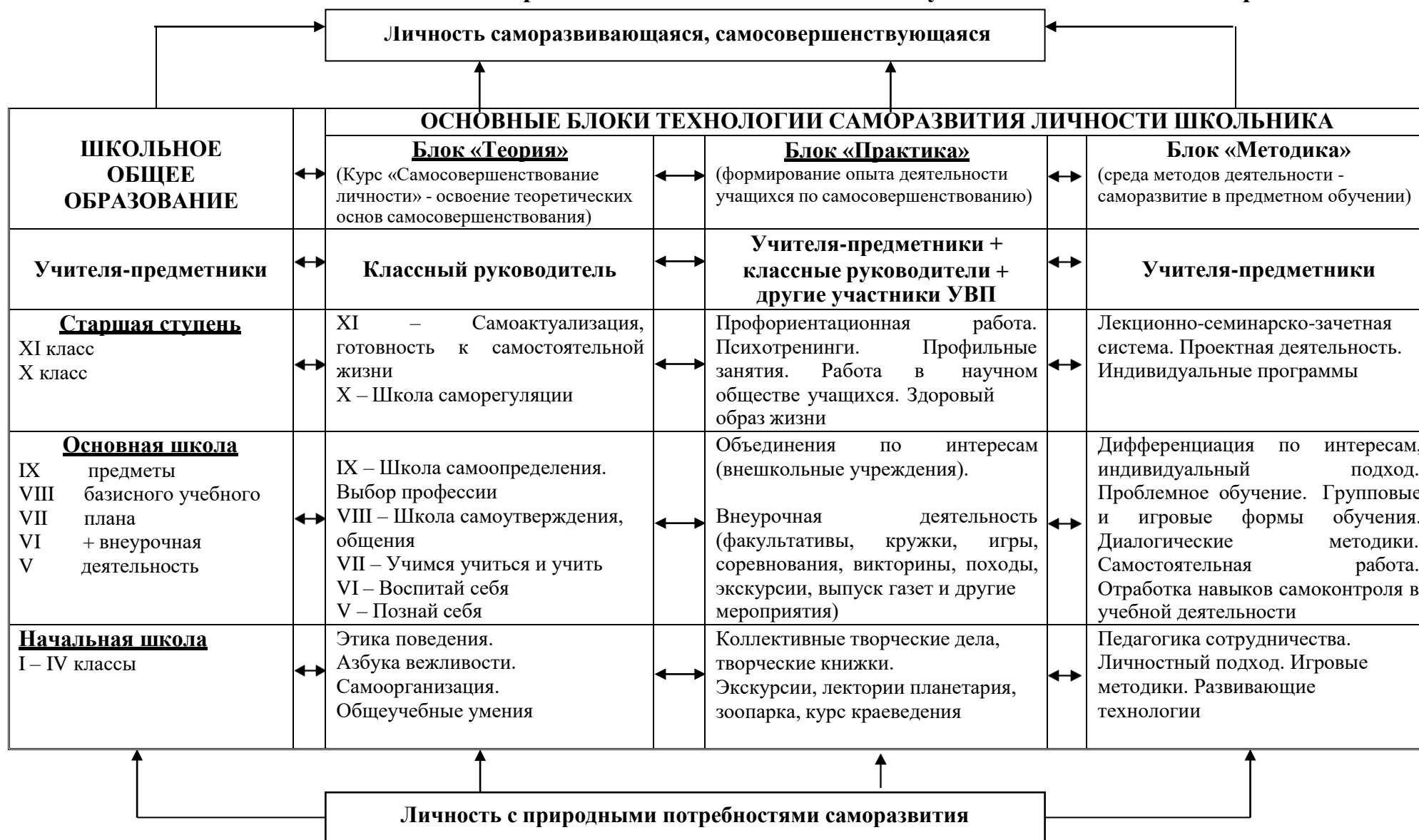
Схема включения технологии саморазвития личности школьника в учебно-воспитательный процесс